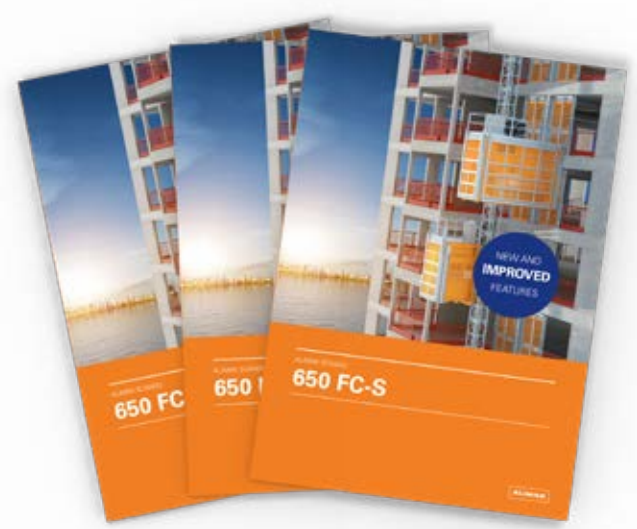
Säljbroschyr: Alimak Scando 650 FC-S