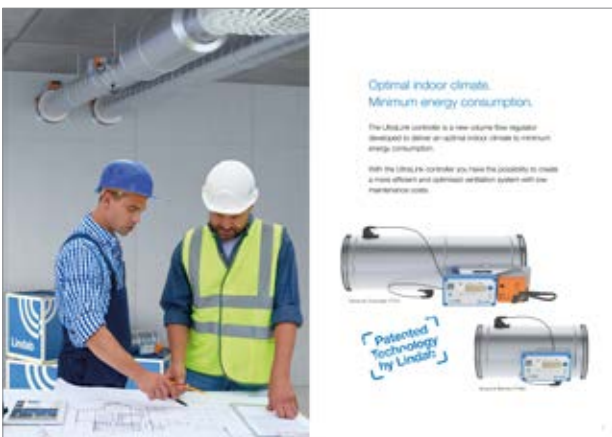
Säljbroshyr: UltraLink Controller

Tryckmaterial | Video | Reklambilder | Power Point