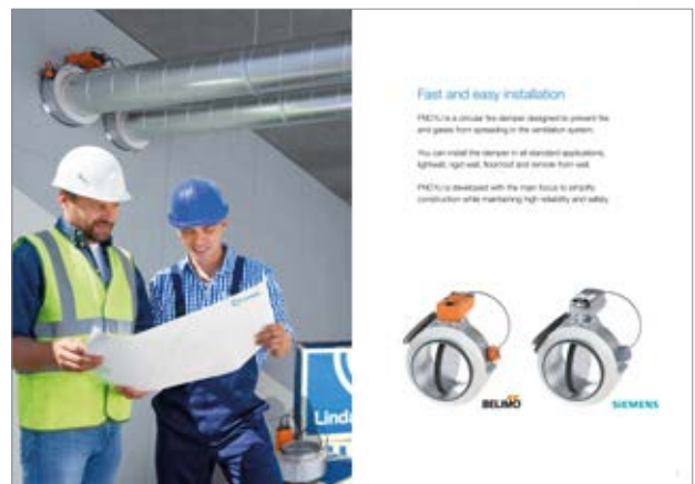
Säljbroshyr: Fire Damper