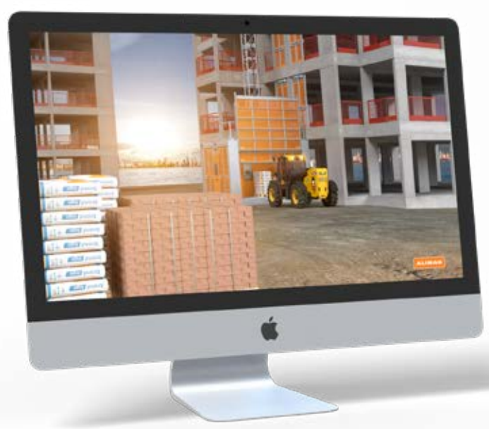
Video presentation: Alimak Scando 650 FC-S